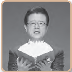
토비세 72구절 성경암송