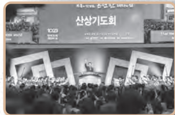
한국교회 섬김의 날