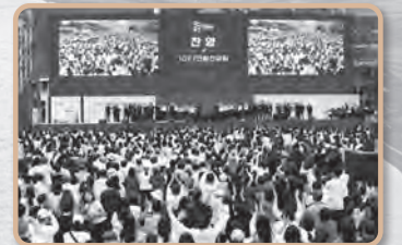
10.27 한국교회 2백만 연합예배(2024)