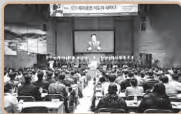
CAL 제자훈련 지도자 세미나