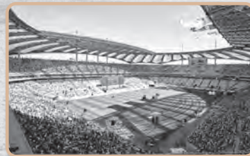
빌리그래함 전도대회 50주년 기념대회(2023)