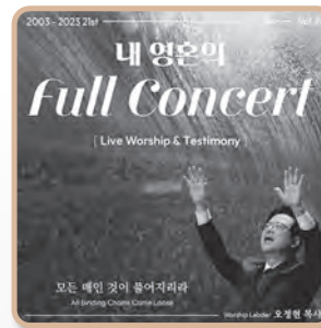
내 영혼의 Full Concert