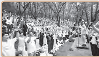
청계산 산상 구국기도회