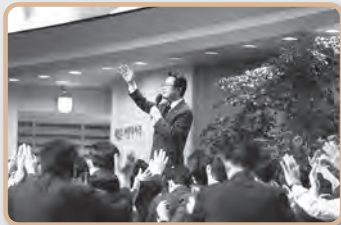
예배를 위한 강단기도회