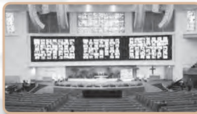
코로나 유행 중 비대면 예배(2020)