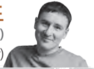
슬라빅 페이스 목사(우크라이나 침례신학교 총장)

전쟁의 한복판에서도 우리가 보이지 않는 소망을 붙들며 기도할 수 있는 이유를 나누고자 합니다. 첫째, 우리 존재의 이유를 아는 것이 삶을 지탱하는 힘입니다. 고통 속에서도 삶의 의미를 붙들면 견딜 수 있습니다. 둘째, 현실은 바꿀 수 없어도, 반응은 선택할 수 있습니다. 고통 중에도 예수님께 시선을 고정할 때 사랑과 위로를 전하는 사명이 생깁니다. 셋째, 다른 이를 섬김으로 마음의 균형을 지킬 수 있습니다. 회복은 나눔에서 시작됩니다.