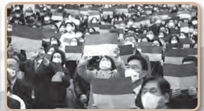
고난받는 우크라이나를 위한 기도회(2022)