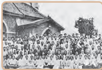
나라를 지켜낸 초량교회 구국기도회(1950)