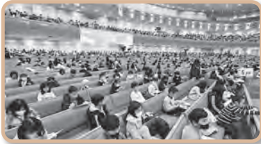
영적 과거제도(전국주일학교 성경고사)