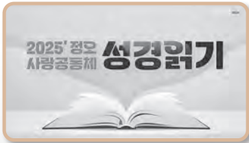
정오 사랑공동체 성경읽기