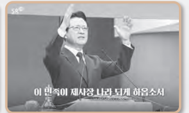
대한민국 국가 안정과 국민 통합을 위한 기도회(2025)